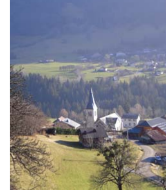
Eglise de Chevenoz